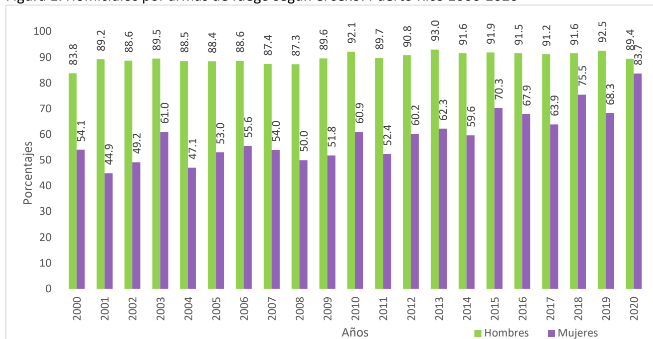
Figura 1. Homicidios por armas de fuego según el sexo: Puerto Rico 2000-2020

Las estadísticas anteriormente citadas demuestran el alto riesgo de morir por homicidio con armas de fuego en la población de jóvenes en Puerto Rico. En el 2011, el riesgo fue 23.7 veces mayor en hombres en relación con el riesgo de homicidios en mujeres y en el año 2020 este riesgo fue de 11.9 lo que sugiere que el riesgo en mujeres está incrementándose (ver Tabla 1 y Figura 2). Cabe destacar que, en todos estos años, las tasas de homicidio en la población de jóvenes hombres de Puerto Rico reflejan un riesgo similar al de conflictos armados.