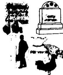
Division de Coste de Vida