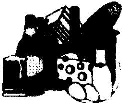
Alimentos y Bebidas