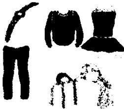
Alquiler y Servicios Públicos